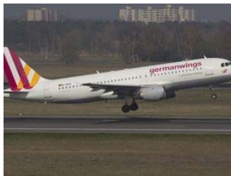
Keine Überlebenden bei Flugzeugabsturz über...